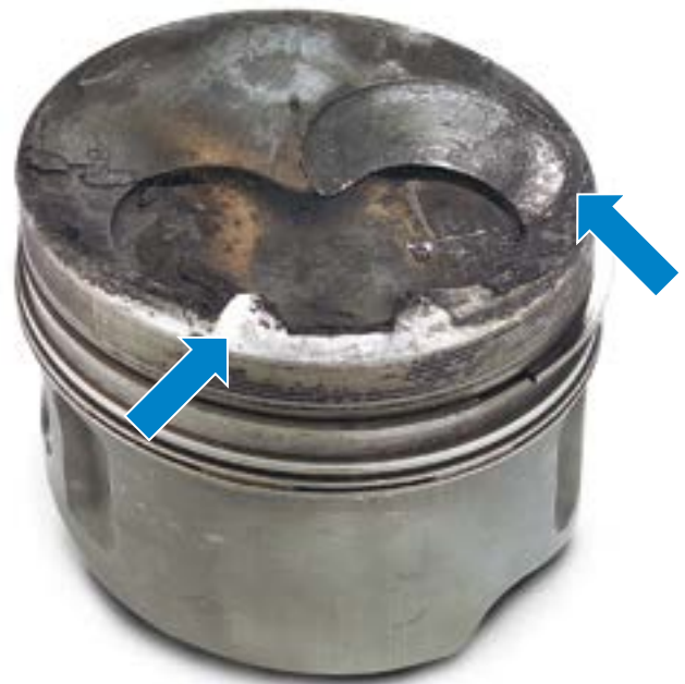
Fig. 4 Tracce di urti dovuto al surriscaldamento del motore