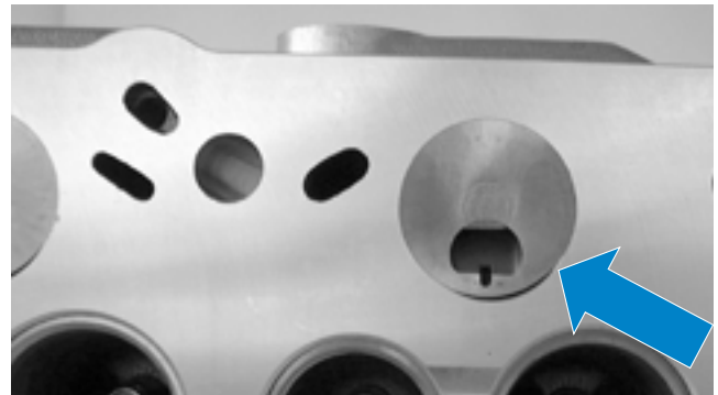
Fig. 1 Testata con inserti della camera a turbolenza montati

I problemi alle testate con camere a turbolenza si manifestano prevalentemente in caso di surriscaldamento del motore, a causa di riparazioni errate o di una gestione errata delle testate. Seguono qui le risposte alle domande più frequenti.